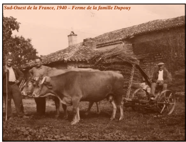
Sud-Ouest de la France, 1940 - Ferme de la famille Dupouy