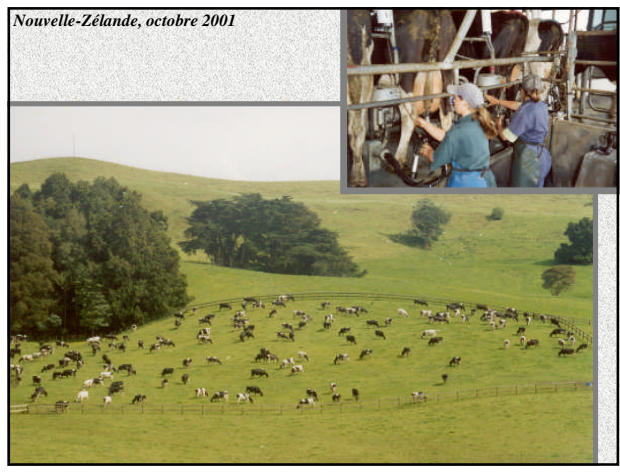
Nouvelle-Zélande, octobre 2001