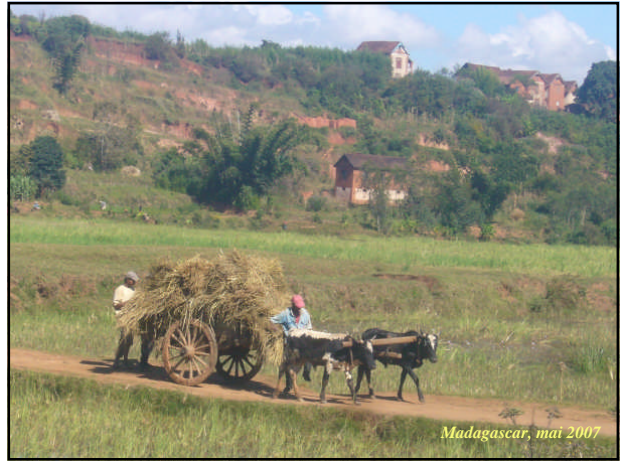
Madagascar, mai 2007