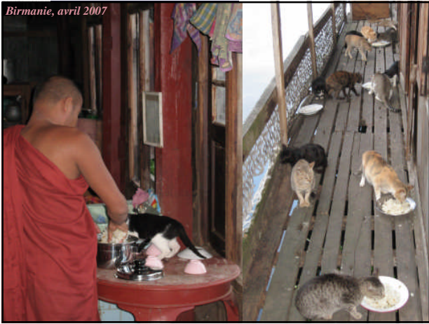
Birmanie, avril 2007